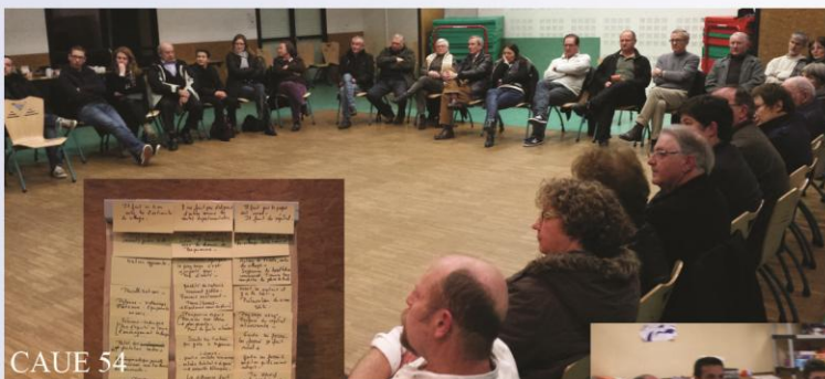
Photos de la réunion publique du jeudi 15 janvier 2015 au centre polyvalent